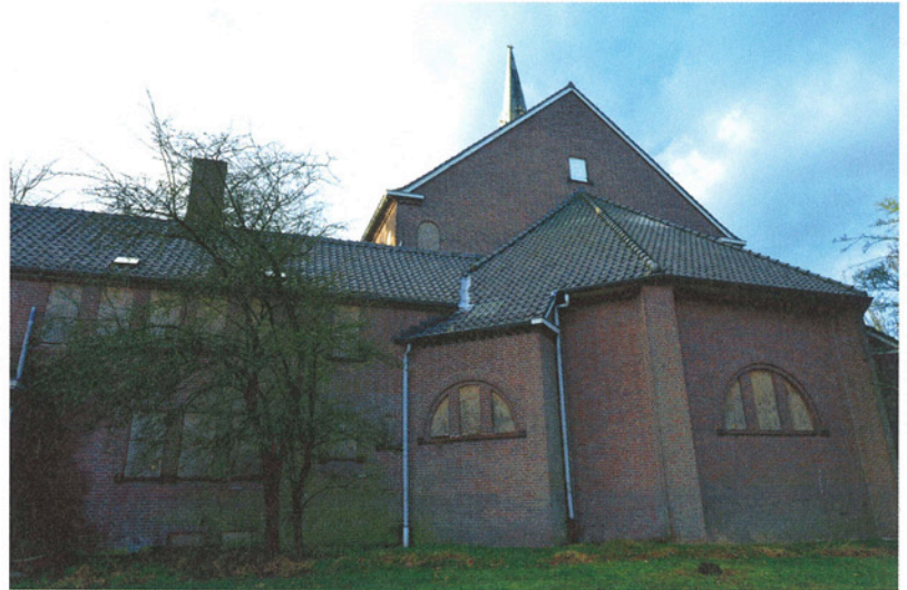
▲ De leegstaande kerk in Maliskamp met – onbewust symbolisch – dichtgetimmerde ramen.

Waarom kan de impasse niet worden doorbroken? Wethouder Geert Snijders verwijst naar de sociaal-religieuze bestemming die in 1934 werd vastgelegd toen het terrein waarop de kerk staat aan de parochie werd geschonken; in het kader van erfdiensbaarheid moeten 'ongeveer 150 mensen met een eventuele wijziging van de Bernadettekerk instemmen.' Een